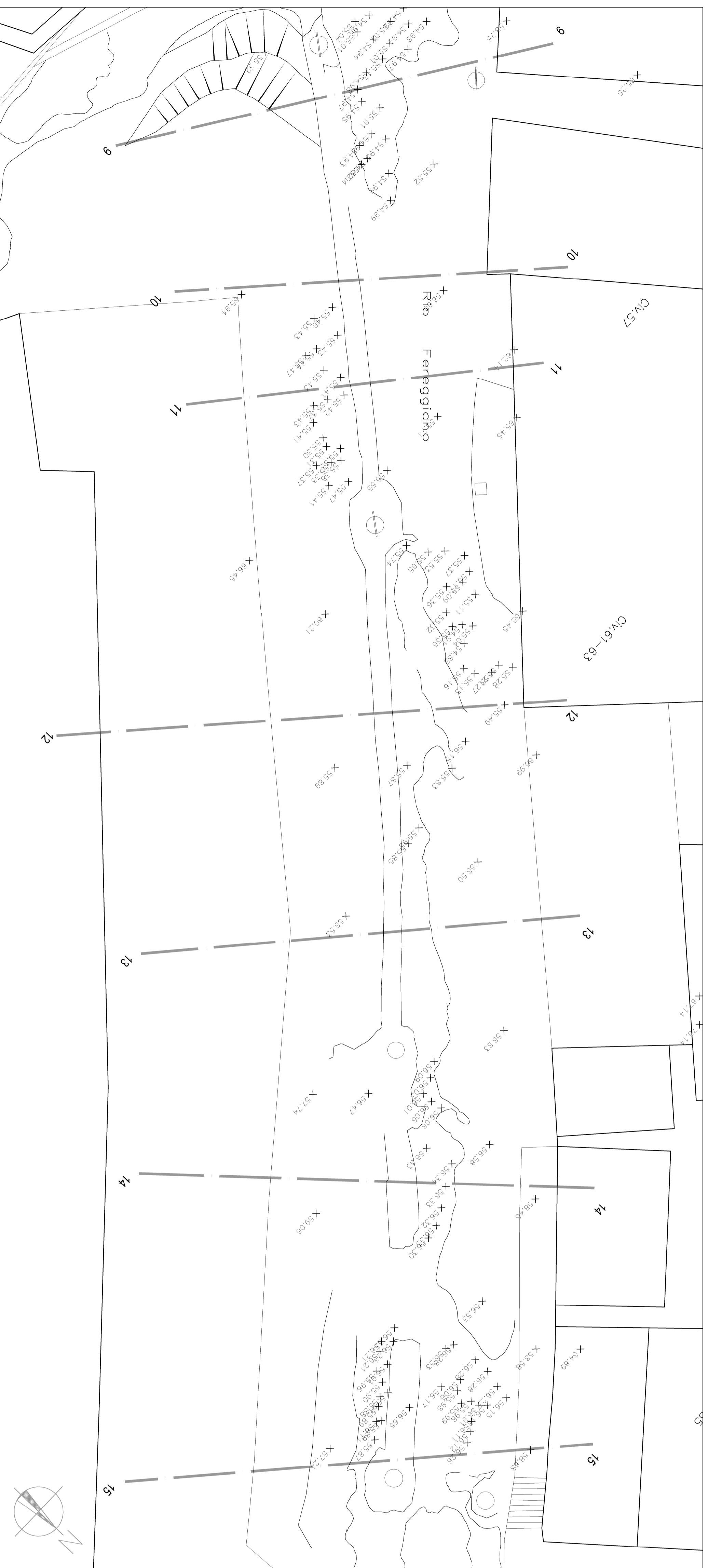
Planimetria di progetto - sezioni 9 - 15